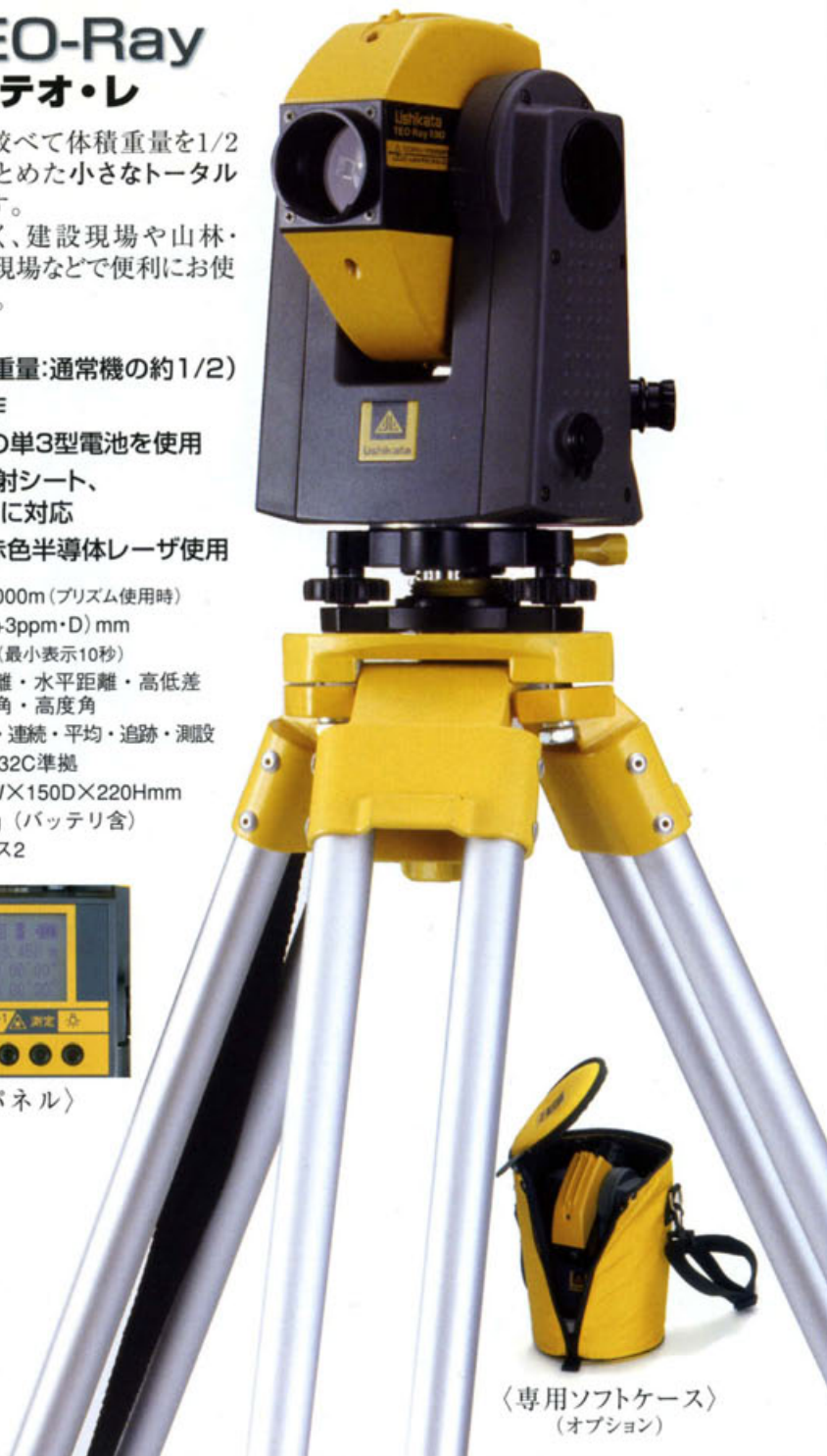
〈専用ソフトケース〉 (オプション)