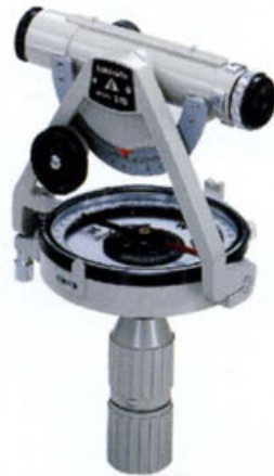
S-28 ポケットコンパス (牛方式半円高度分度付)