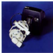
耐水合成樹脂ケース入