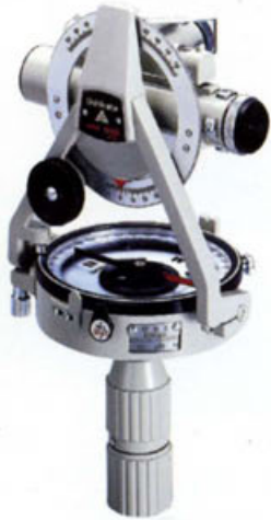
LS-25 レベルトラコン (レベル兼用コンパストラナシット)

トラコン/レベルトラコンは現場作業に照準を合わせて設計されています。小型・軽量のボディに、必要精度・機能を完全装備。設置も簡単で、手軽に測量が可能です。