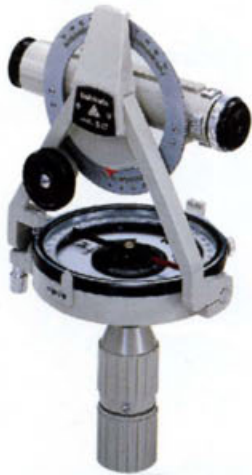
S-27 ポケットコンパス (牛方式全円高度分度付)