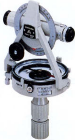
S-25 トラコン (5分読コンパストラナシット)

トラコン/レベルトラコンは現場作業に照準を合わせて設計されています。小型・軽量のボディに、必要精度・機能を完全装備。設置も簡単で、手軽に測量が可能です。